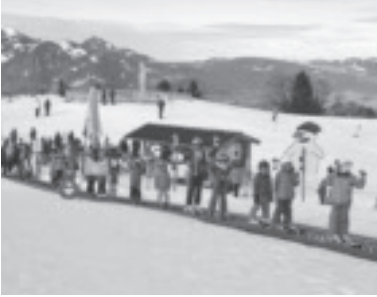
Schikurs in Furx

Neben dem Kaderbetrieb, Training und Rennen, dem Organisieren von Schirennen und dem Betrieb des Clubheims stellt der Schiverein noch Schilehrer für den Schikurs in Furx. Die Schikurse wurde in den Weihnachts- und Semesterferien erfolgreich durchgeführt.