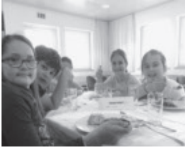
Mittagessen im Bildungshaus Batschuns