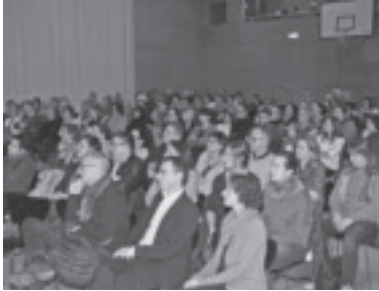
Vortrag am 14.01.2018 im Frödischsaal

„Die Grundlagen wie Lesen, Schreiben und Rechnen muss jedes Kind beherrschen. Es ist die Aufgabe von uns allen, die Kinder in ihren Stärken zu fördern und nicht auf den Schwächen herumzuhaken.“ Eine zusätzliche Person in der Schule, der sogenannte Talentescout, soll bei der Entdeckung der Talente in den Kindern unterstützend wirken. Es ist uns ein besonderes Anliegen, in unserer Gemeinde so einen Talentescout zu aktivieren. Dazu gibt es schon konkrete Überlegungen.