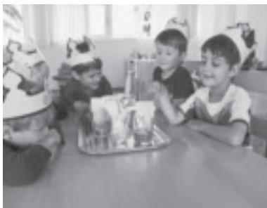
Wasserexperimente im KG Dafins

Mit dem Thema „Sonnenenergie“ haben wir dieses Kindergartenjahr abgeschlossen und uns bei einem gemeinsam Fest mit der Volksschule in die Ferien verabschiedet.