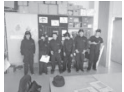
Wissenstest 2018 in Mäder