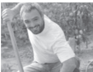
Asylwerber hilft bei Gartenarbeit