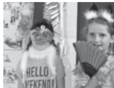
Spaß mit der Fotobox