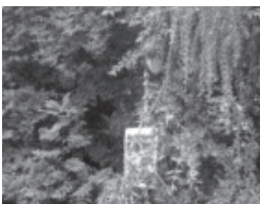
Hinweisschilder sind kaum noch sichtbar