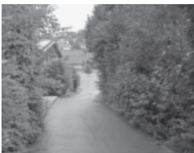
Hecke wächst in Straße hinein