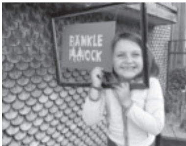
„Bänkle Hock“ Täfile angebracht - Check!