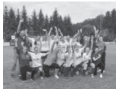
...und des 1c des FFC fairvesta Vorderland