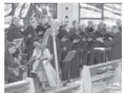
Mundartmesse in der Pfarrkirche Muntlix