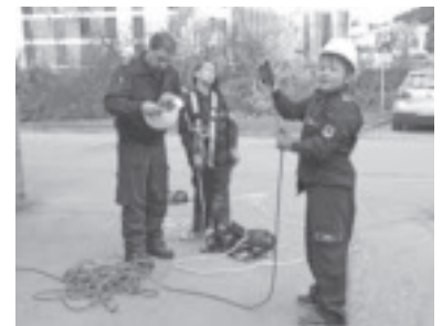
Knotenkunde inkl. Abseilübung