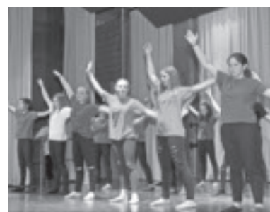
Showprogramm im Frödischsaal