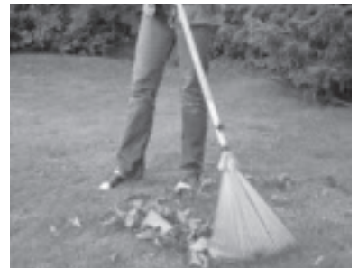
Unterstützung beim Laub kehren