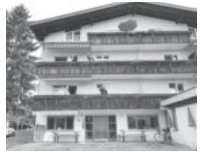
Wohnhaus in Muntlix