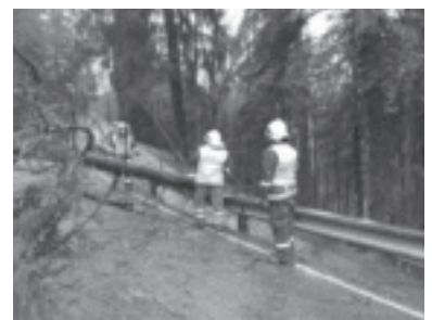
Sturmtief Jänner 2018 in der Furxstraße