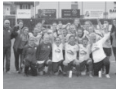
Die Meistermannschaften des 1b...