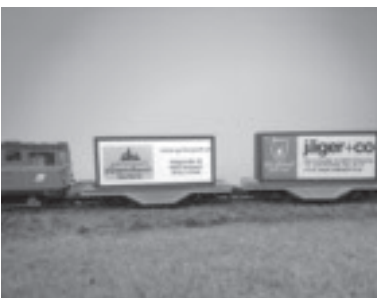
Zug mit unseren Sponsoren Wagen und Container sind im Selbstbau entstanden

Herbert Plank, Wanne 5, 6835 Zwischenwasser | E-Mail: info@mbf-oberland.info