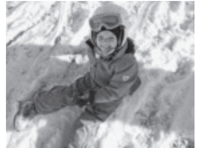
Spaß im Schnee