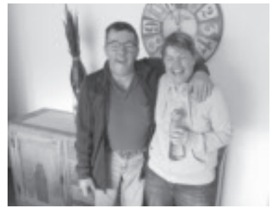
Langjährige Bewohner des Wohnhauses in Muntlix