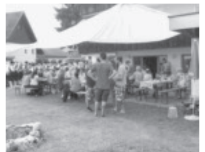
Jubiläumsfest Sommer 2017