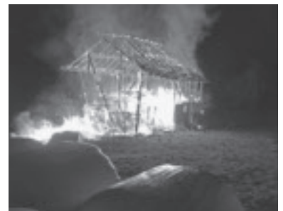
Brand in Buchebrunnen