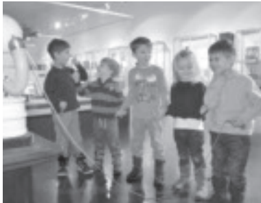
Zu Besuch im Elektromuseum Frastanz