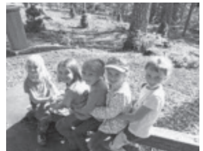
Zu Besuch im Wildpark Feldkirch