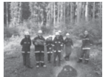
Die Feuerwehrjugend Zwischenwasser