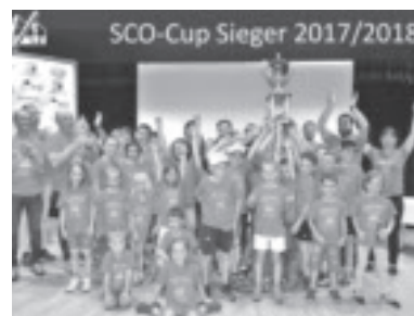
Große Freude über den Pokal