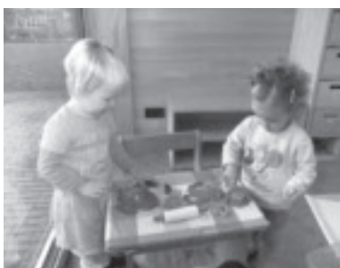
Das Spielen mit der Knete macht uns besonders Spaß