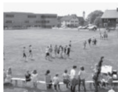
Sponsorenlauf für das Kinderdorf