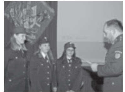
Angelobung der neuen Mitglieder