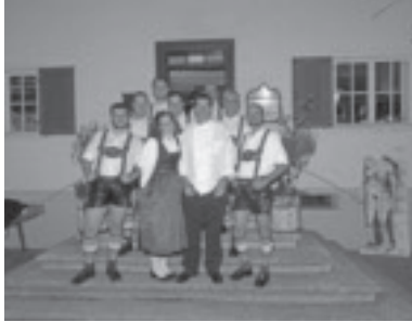
Auftritt im Rankweiler Hof