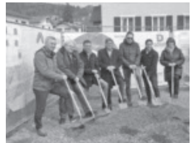
Spatenstich Wohnanlage Hauptstraße - Alpenländische Heimstätte