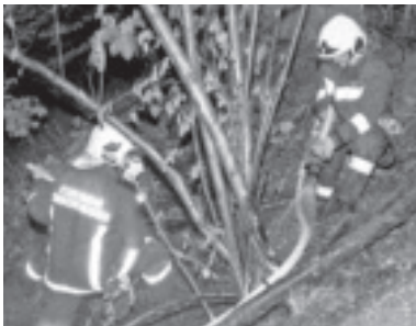
Kleiner Waldbrand Eschenrain

_Sonntag, 15.07.2018 Vormittag: Festmesse mit Fahrzeugweihe und Frühschoppen, Nachmittag: großer Festumzug durch Muntlix, Festausklang mit den „Partyjäger“