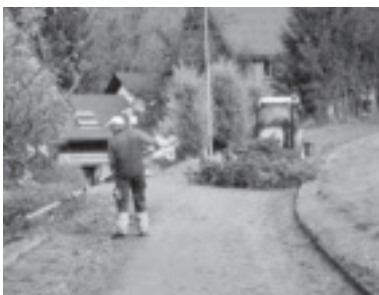
Das Bauhof team im Einsatz