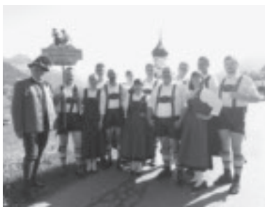
Umzug in Raggal