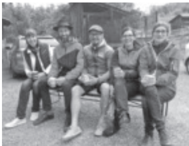
Erster „Bänkle Hock“ in Zwischenwasser

Am 1. Mai fand der erste Bänkle Hock in Zwischenwasser statt. Die vom Sozialausschuss initiierte Veranstaltung nach dem Vorbild des Bänkle Hock in Nüziders war trotz des frischen und wenig einladenden Wetters ein Erfolg. Insgesamt wurden 20 Bänkle zur Verfügung gestellt – 15 in Muntlix, 1 in Dafins und 4 in Batschuns. Neugierige Besucher, insbesondere Familien, Neulinge aus dem Dorf sowie Verwandte und Bekannte der Bänkle Besitzer nutzten den Feiertag für einen gemütlichen Spaziergang von Bänkle zu Bänkle. Vor Ort ließen sich die Gastgeber zur Unterhaltung einiges einfallen. Es wurden Lieder gesungen und Gedichte zitiert, Fotos gemacht, Kaffee, Kuchen und ein Gläschen (Glüh-) Wein serviert oder einfach nur gequatscht und neue Bekanntschaften geschlossen. Das primäre Ziel, den Kontakt unter den Dorfbewohnern zu fördern, wurde definitiv erreicht. Die Gemeinde Zwischenwasser ist überzeugt von der Idee und möchte auch nächstes Frühjahr wieder einen Bänkle Hock veranstalten. Dann wird hoffentlich das Wetter besser mitspielen und noch mehr Bänklebesucher und -besitzer mit dabei sein.