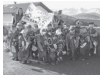
Fasching im Kindergarten Batschuns