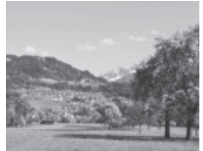
Blick von Sulz nach Batschuns