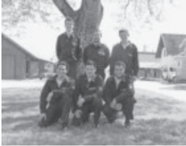
Bewerbsgruppe Kuppelcup in Lustenau