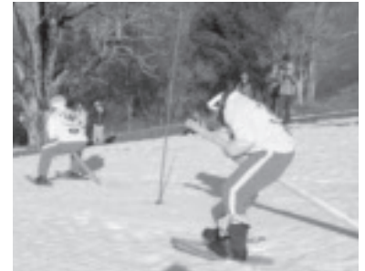
Charity-Rennen in Furx

Das von unseren Altherrenkickern gemeinsam mit dem Schiverein Sulz-Röthis und dem HD-Club Shovel Power veranstaltete 6. Charity-Rennen in Furx wurde wieder zu einem tollen Erfolg. Der Erlös kam heuer einer Familie in Koblach, die zwei kranke Kinder hat und viel Geld für Therapien, medizinische Geräte u. a. benötigt, zu Gute. Dank der Unterstützung vieler Sponsoren, der Teilnehmer und der Zuschauer schaute am Ende ein Rekordergebnis von imposanten 8.653,- Euro heraus. Durch weitere Spenden danach erhöhte sich der Erlös schlussendlich auf über 9.000,- Euro. Das Charity-Rennen hat inzwischen einen so guten Namen, dass am Samstagabend sogar vom ORF in der Sendung „Vorarlberg heute“ ein Beitrag gesendet wurde.