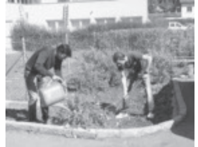
Unterstützung bei Gartenarbeit