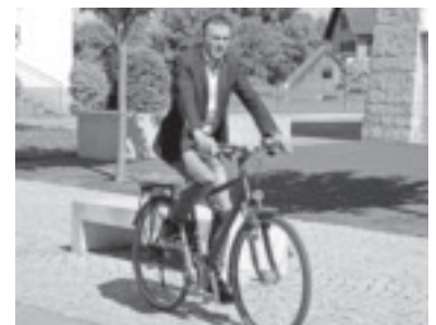
Unser Bürgermeister umweltfreundlich unterwegs

Im Vorderland wird wieder fleißig geradelt. Gesamt radelten bis Anfang Juni 161 Teilnehmer bereits 56.566 km und konnten dadurch 5.449 kg CO 2 vermeiden. Mit 1,65 Millionen verbrannten kcal wurde auch die eigene Gesundheit unterstützt.