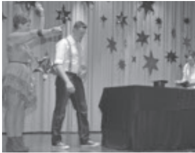
Schuhplattlerball am 03.02.2018

Die Schuhplattler haben tatkräftig beim Aufbau der Hallenradball-WM vom 20. bis 22.11.2017 mitgeholfen.