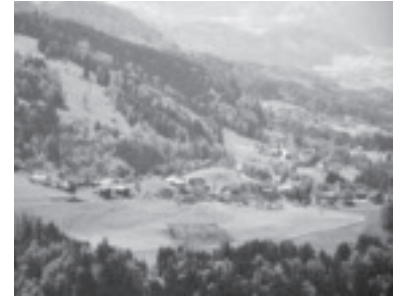
Gemeinnütziges Wohnprojekt in Dafins

Nun ist es fix. Die Gemeindevertretung hat am 19. April 2018 mit großer Mehrheit beschlossen, dass die Kleinwohnanlage mit 12 Wohneinheiten in Dafins im Baurechtsverfahren gemeinsam mit der Alpenländischen Heimstätte umgesetzt wird. Der Baubeginn ist auf Anfang 2019 anvisiert. Erfreulich ist auch, dass das Land Vorarlberg gemeinsam mit dem Energieinstitut diese zwei Baukörper als Wohnbauforschungsprojekt fördert. Die Schwerpunkte dieses Forschungsprojektes sind im Bereich der Wärmeversorgung, der Lebenszykluskosten, der sommerlichen Behaglichkeit, der Nutzung von gebäudeintegrierter Photovoltaikanlagen, der Mieterstrommodelle und der Umsetzung von Maßnahmen zur Erleichterung umweltfreundlicher Mobilität angesetzt.