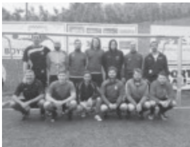
Trainingslager in St. Pauls

In den Meisterschaftsspielen danach funktionierten das Zusammenspiel und die Umstellungen unserer Taktiken immer besser und so konnten wir gegen den RW Rankweil die ersten 3 Punkte einfahren.