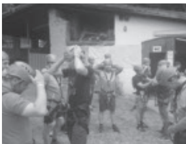
Klettergarten im Südtirol