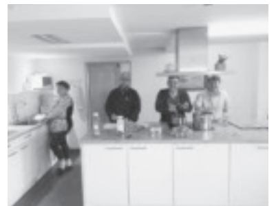
Wohngemeinschaft mit eigener Küche