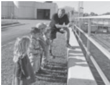
Besichtigung der Kläranlage Vorderland

Begleitete uns im Herbst noch das Thema „Windkraft und Mobilität“, so forschten wir in den Wintermonaten zu „Licht und Strom – Kälte und Wärme“: Wir schauten uns im Kindergarten, aber auch zu Hause um, wofür wir überhaupt Strom brauchen und in welchen Bereichen dieser verwendet wird. Bei einem Besuch im Elektromuseum in Frastanz entdeckten wir Geräte, die früher im Haushalt Verwendung fanden. Der Besuch im Schmiedemuseum Kieber in Röthis war ebenfalls sehr eindrucksvoll.