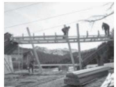
Voller Einsatz beim Freiwilligentag 2018