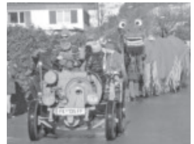
Halli-Galli in Sulz