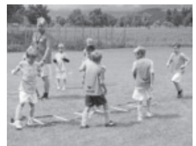
Spiel und Spaß im Fußballcamp