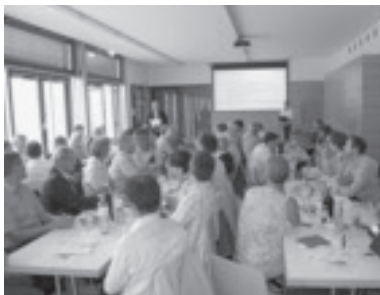
Regio-Sitzung in Sulz