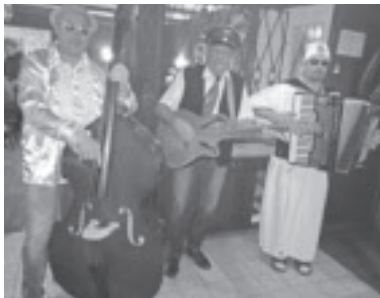
Alpensound Trio in Üsra Krona

Auch unsere erste Jahreshauptversammlung von „Üsra Krona – Verein zur Dorfgestaltung“ ging am 06. April 2018 in unserem Krona Saal über die Bühne.