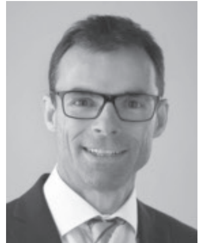
Bürgermeister Kilian Tschabrun