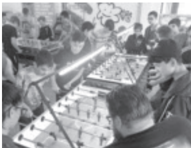
Gemütlicher Nachmittag im Jungentreff

Die Offene Jugendarbeit holt die Jugendlichen dort ab, wo sie stehen. Finanziert wird die gemeinnützige Organisation von acht Vorderlandgemeinden und dem Sozialfond des Landes Vorarlberg. Die Zielgruppe sind Jugendliche ab dem 10. Lebensjahr unabhängig von Geschlecht, Nationalität, Religion, sexuellen Orientierung oder Behinderung. Sie können die drei Jungentreffs in Weiler, Röthis und Laterns nutzen und dort sinnvoll ihre Freizeit gestalten. Zusätzlich gibt es ein buntes Programm mit Aktivitäten wie gemeinsames Kochen, Themenpartys, Mädchen- und Jungsabende, Workshops, Ausflüge, Projekte, Präventionsarbeit und situationsbezogene Interventionsarbeit. Die geschulten Mitarbeiter beraten bei Problemen oder Helfen etwa bei der Suche nach einer Lehrstelle. In Muntlix wurde im Juni ein Selbstverteidigungskurs für Mädchen angeboten. Weitere Projekte sind in Kooperation mit dem Sozialausschuss in Planung. Haben Sie eine Idee? Dann kontaktieren Sie den Sozialausschuss. Mehr über die Offene Jugendarbeit finden Sie unter https://vorderlandhus.at/offene-jugendarbeit