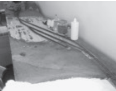
Neubau von einigen Modulen

Im Sommer 2017 fanden sich einige Modellbahner zusammen und gründeten den Verein „Modell Bahn Freunde Oberland“. Wir konnten einen Teil der Modellbahn-Anlage des Modell-Bahn-Clubs Rankweil übernehmen und diese im Keller der Krone Dafins wieder in Betrieb nehmen.