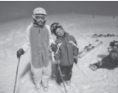
Night-Race mit 60 Teilnehmern

Am Sonntag, den 04.02.2018 fand unsere Vereinsmeisterschaft in Laterns statt. Über 90 SVZ-Mitglieder haben sich angemeldet und sind das Rennen bei sehr guten Bedingungen gefahren.