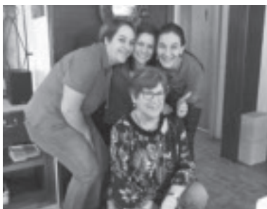
„Üsre Krona“ Team