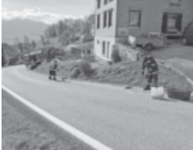
Ölspur in Dafins

Der zweite Kuppelcup in der Bewerbungssaison fand am 12. Mai 2018 in Blons statt. Bei diesem Bewerb nahmen 2 Gruppen unserer Wehr teil.