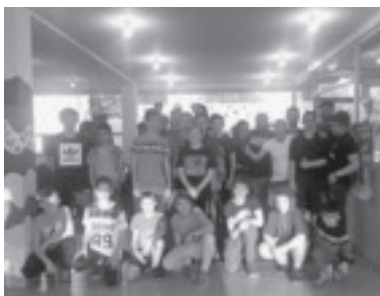
Da ist immer was los!

Nach 23 Jahren bestand musste 2016 das erfolgreiche Projekt „Nachbarschaftshilfe“ der Caritas eingestellt werden. In Folge bemühte sich das Land Vorarlberg um eine Neuregelung. Mit der „Nachbarschaftshilfe neu“ wird Asylwerben wieder ermöglicht, für Bund, Land, Gemeinde und Private in Haus und Garten Hilfsarbeiten zu übernehmen. Pro Monat dürfen sie maximal 110 Euro verdienen. Die Asylwerber und Asylwerberinnen können sich aktiv einbringen und kommen mit der Bevölkerung in direkten Kontakt. Das wirkt der Bildung von Vorurteilen entgegen und fördert Verständigung und Toleranz. Zudem bietet sich dadurch die Gelegenheit, regionale Gepflogenheiten und die Kultur besser kennen zu lernen. Auch die Gemeinde Zwischenwasser unterstützt die „Nachbarschaftshilfe neu“ aktiv. Interessenten können sich jederzeit bei der Gemeinde oder direkt bei der Caritas melden.