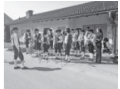
Erstkommunion in Batschuns

Am Funkensonntag durfte der Musikverein Cäcilia Batschuns das Funkenabbrennen in Batschuns musikalisch umrahmen. Gemeinsam mit dem Fackellauf marschierten wir zum Funkenplatz. Es wurden verschiedene Musikstücke vor dem brennenden Funken gespielt, bis sich schlussendlich die Hexe mit einem lauten Knall verabschiedete.