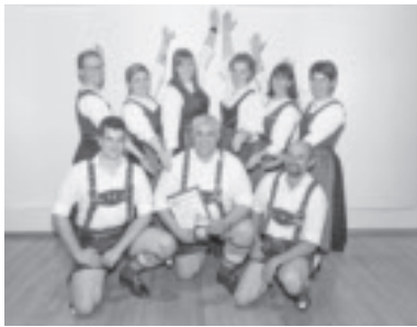
Jahreshauptversammlung am 07.04.2018

Clowns, Indianer und viele andere Maskierte kamen am Nachmittag zum Kränzle. Tolle Musik heizte die Stimmung auf und alle Frauen waren sofort auf der Tanzfläche. Beim „Frauenspiel“ war Treffsicherheit gefragt. Wer ein ruhiges Händchen und ein gutes Auge hatte, konnte tolle Preise mit nach Hause nehmen.