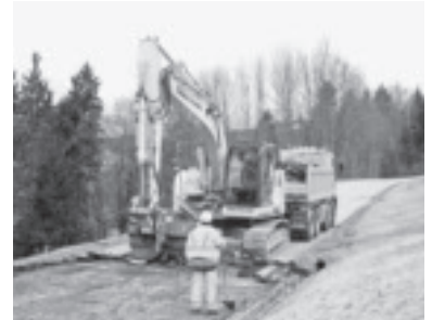
Entfernung Straßenbelag Furxstraße