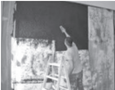
Handwerk in Vollendung