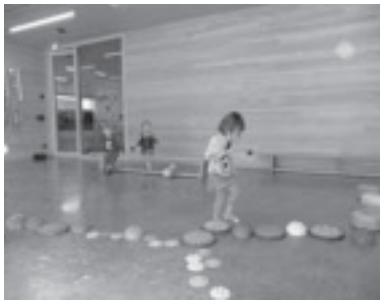
Spaß im Bewegungsraum