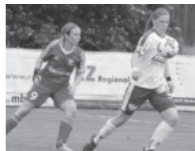
Die Kampfmannschaft gilt als Überraschungsteam der 1. Bundesliga