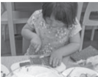
Heute darf ich selber kochen!

Anfang April durften die Kinder ihre Jause selber kochen und zubereiten. Verschiedenste Rezepte wurden ausprobiert – vom Powermüsli bis hin zu den Karottenmuffins. In dieser Woche war uns wichtig, dass die Kinder vieles über die gesunde Ernährung erfahren.