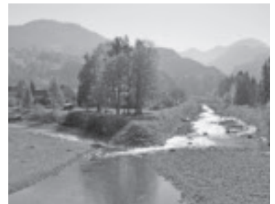
Spitz Frutz und Frödisch