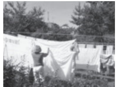
Unterstützung bei der Hausarbeit