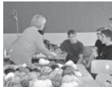
Und der schnellste Häkler ist...