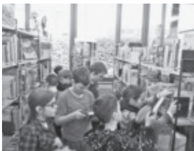
VS Dafins in der Bücherei Muntlix

Seit einigen Monaten besuchen die Kinder der VS Dafins regelmäßig die Bücherei in Muntlix. Es ist jedes Mal etwas Besonderes, aus so vielen Büchern ein spannendes Lesebuch auszuwählen. Langsam entwickeln sich die Kinder zu kleinen und großen Büchereiprofis. An dieser Stelle möchten wir uns ganz herzlich beim Büchereiteam Muntlix bedanken.