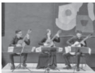
„Bayern meets Peru“

Nach großem Applaus und einer Zugabe stärkten sich die Konzertbesucher und Musiker noch bei einem Glas Wein und fielen dabei in anregende Gespräche. Der Kulturverein „batschuns kulturell“ und das Bildungshaus freuten sich über diesen gelungenen Konzertabend – Bayern meets Peru in Batschuns!