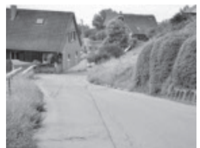
Straßenschäden in Dafins Oberberg