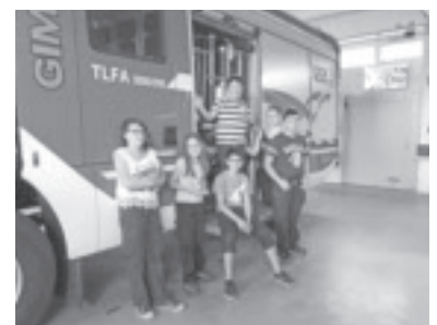
Mitglieder der Feuerwehrjugend