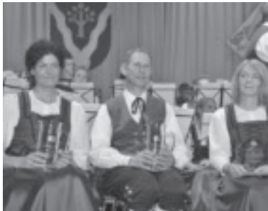
Ehrung langjähriger Mitglieder