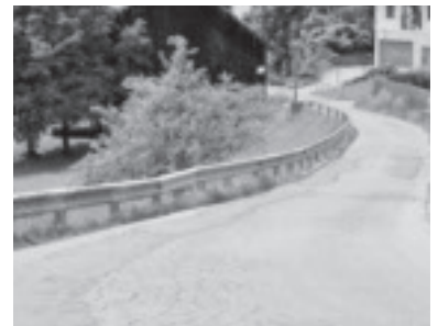
Straßenschäden in Dafins