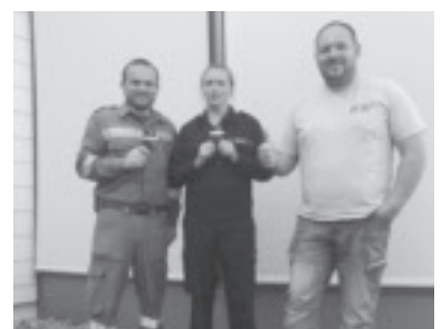
Funkleistungsabzeichen in Gold